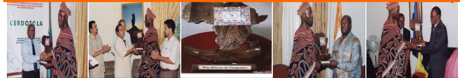
Voici le trophée du Prix Africain de l'Intégration et ses précédents Lauréats