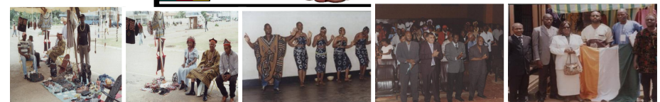
Ci-dessus les photos ayant immortalisé les activités culturelles, commerciales et scientifiques

Du 23 au 25 Mars 2011 Programme scientifique et pédagogique : Lieu maison du parti de NKOMKANA