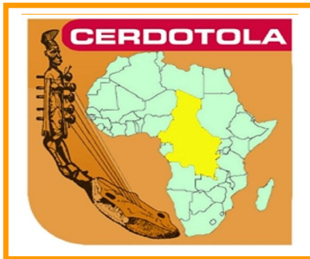
Table ronde sur l'apprentissage des langues maternelles du Cameroun.

Alors à bonne entendre AFRICAINEMENT VOTRE !